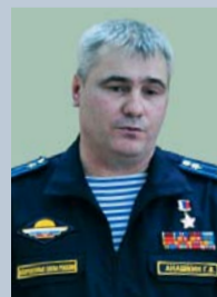
50 лет (17.12) Герой Российской Федерации АНАШКИН Геннадий Владимирович