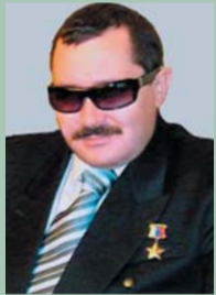
50 лет (8.11) Герой Российской Федерации ЗАРИПОВ Альберт Маратович