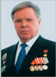
75 лет (7.11) Герой Советского Союза ГРОМОВ Борис Всеволодович