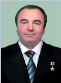
65 лет (1.12) Герой Российской Федерации ГИМБАТОВ Магомед Махмудович